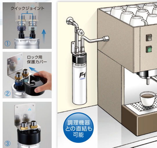
クイックジョイントにワンタッチで接続し、ロック用保護カバーでカートリッジが外れないようロックすることで、簡単にカートリッジの交換ができます。